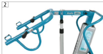
dualo® aktiv mit Hebearm aktiv smart