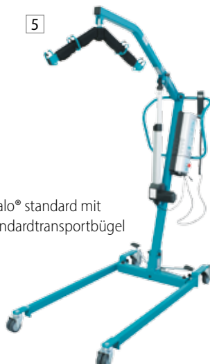
dualo® standard mit Standardtransportbügel