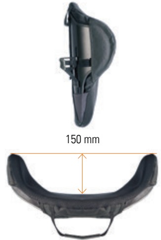
// Mittlere Tiefe Kontur (MDC /XMDC)