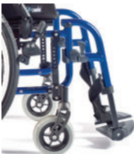
// LI1010017 Neuro Rahmen