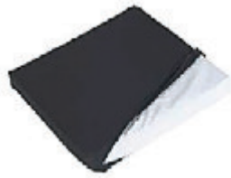
// Sitzkissen, Klimamembran mit Nässechutz, Bezug mit Reißverschluss, schwarz