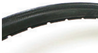
// LI1070102 Bereifung, pannen- sicher