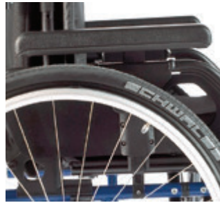
// LI1040054 Seitenteil mit Armpolster (300 mm), höhen- und tiefenverstellbar