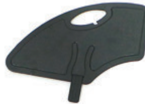
// LI1040107 Kunststoff, abnehmbar