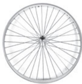
// LI1070002 Antriebsrad, Design