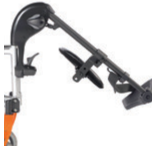
// LI1050009, LI1050010, LI1050011 Fußbretthalter hochschwenkbar (ELR)