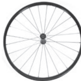
// LI1070003 Antriebsrad, Leicht- gewicht