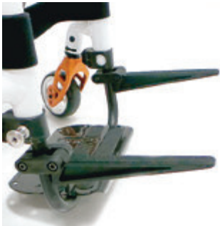
// LI1090019 Caddy, hochklappbarer Träger für Taschen