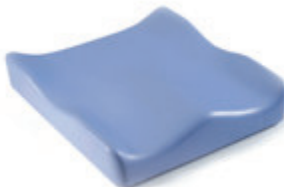
// JAY020003 JAY Soft Combi P Kissen (Bild zeigt Kissen ohne Bezug)