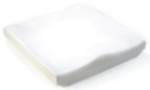
// JAY020002 JAY Basic Kissen (Bild zeigt Kissen ohne Bezug)