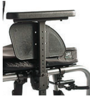
// LI1040052 Seitenteil Zentralstütze, Armpolster, tiefen- und höhenverstellbar