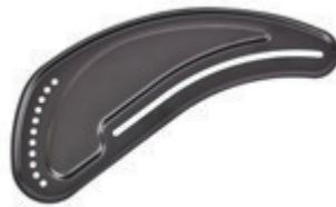
// LI1040102 Aluminium, Kälteschutz