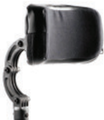
// LII030410 Kopfstütze, groß, höhen- / tiefen- / winkelverstellbar, 23 x 11 cm