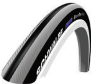
// LI1070101 Schwalbe Right Run