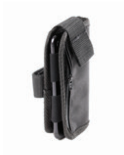
// LI1090026 Handytasche