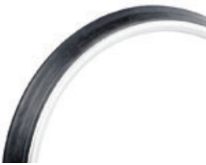
// LI1070208 Max Grepp®