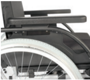
// LI1040053 Seitenteil mit Armpolster