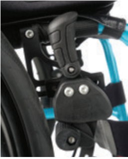
// LI1060002 Kniehebelbremse