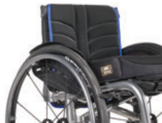
// LII030317 EXO PRO Rückenbespannung (Exo Evo Version)