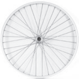
// LI1070001 Antriebsrad, Universal