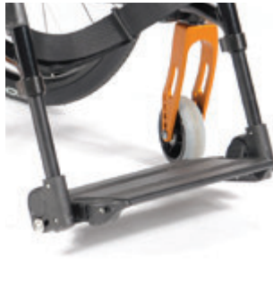
// LI1050023 Fußbrett durchgehend Aluminium