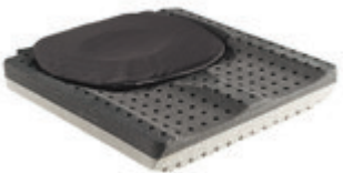
// JAY020004 JAY Lite Kissen (Bild zeigt Kissen ohne Bezug)