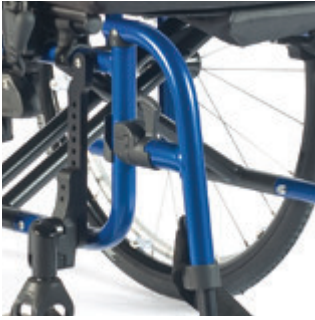
// LI1050006, LI1050007, LI1050008 Fußbretthalter Aluminium 100°