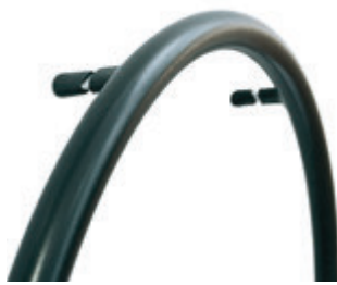
// LI1070207 Supergrip®