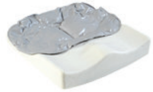
// JAY020007 JAY Easy Fluid Kissen (Bild zeigt Kissen ohne Bezug)