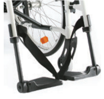
// LI1050020 Fußbrett geteilt Kunst- stoff, winkelverstellbar