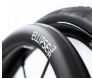
// LI1070212 Ellipse 3R