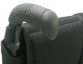
// LII030201 Schiebegriff, lang