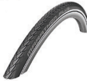
// LI1070104 Schwalbe Marathon Plus Evolution