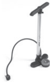
// LI1090024 Standpumpe, Hochdruck