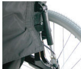
// LII030014 Gasdruckfeder, Schiebegriffe lang (0° - 30°)