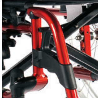
// LI1050003, LI1050004, LI1050005 Fußbretthalter Kunststoff 100°