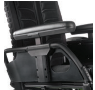
// LI1040058 Seitenteil höhenverstellbar, Einhandbedienung, Armpolster kurz