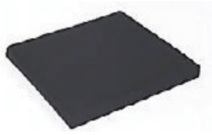
// Sitzkissen, Bezug mit Reißverschluss, schwarz