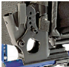
// LII030023 und LII030025 Rückenwinkeleinstellbar (-5° bis 25°)