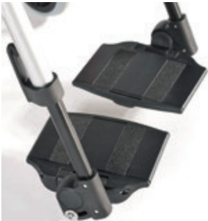
// LI1050022 Fußbrett geteilt Aluminium