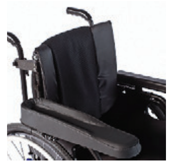
// LI1040110 Hemi-Armauflage XL (tiefen- und winkerverstellbar)