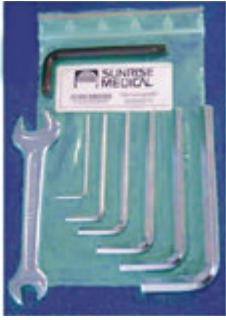
// LI1090000 Werkzeugsatz