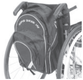
// LI1090030 Rucksack