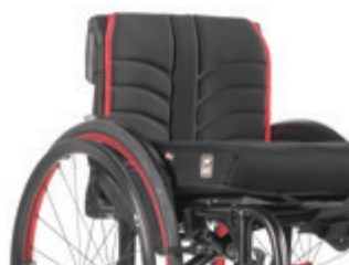
// LII030316 EXO Rückenbespannung (Exo Evo Version)