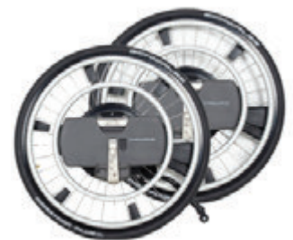
// WDO000201 WheelDrive