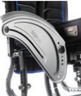
// LI1040103 Aluminium, Kleiderschutz, Kälteschutz